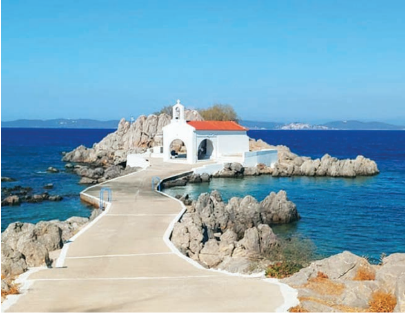
Χίος, η γενέτειρα του Μίκη Θεοδωράκη

ατμόσφαιρα. Ο Μίκης είχε υπέροχο χιούμορ όπως και εμείς ... Η άφιξή μας στο γήπεδο είναι μια στιγμή που δεν θα ξεχάσουμε ποτέ: Ανησυχούσαμε για την εμφάνισή μας στο γρασίδι του γηπέδου και νομίζαμε ότι θα είχαμε πρόβλημα με τον ήχο και με την απόδοση της παράστασης. Οι αμφιβολίες μας διαλύθηκαν γρήγορα χάρη στους εξαιρετικούς τεχνικούς και τους ταλαντούχους ηχολήπτες. Ο θρίαμβος είναι πολύ μικρή λέξη για να το περιγράψει κανείς. Μας καθοδήγησε ο Μίκης. Η δύναμη και η ευαισθησία του διαφαίνονται στην δυνατή, χορευτική και τραγουδιστική του διεύθυνση της ορχήστρας. Είχε έναν αόρατο δεσμό με τους τραγουδιστές και τους μουσικούς του, που τρέφονταν από τα βάσανα, τη δυσaráεσκεια, το θάρρος και την απέραντη χαρά. Ήμασταν συγκλονισμένοι από το κατάμεστο στάδιο. Περισσότεροι από 60.000 άνθρωποι επευφημούσαν αυτό το σύμβολο ελευθερίας και αγώνα. Το κοινό ενθουσιάστηκε από τα τραγούδια της νίκης. Ζήσαμε, αναπνεύσαμε και παίξαμε με ψυχή και πείσμα, καθοδηγούμενοι από τα τραγούδια. Στο τέλος της συναυλίας ακούσαμε ένα απίστευτο χειροκρότημα, μια ξέφρενη εισβολή του κοινού στο γήπεδο προς τον Μίκη. Τα «Percussions de Strasbourg» βίωσε τότε μια αξέχαστη περιοδεία: ξεκινώντας από το γήπεδο «Καραϊσκάκης» στον Πειραιά στις 13 Αυγούστου, έπειτα στο Στάδιο της Πάτρας στις 16 Αυγούστου και πίσω στην Αθήνα στις 18 Αυγούστου όπου ηχογραφήθηκε το διπλό live άλμπουμ των 33 στροφών. Η τελευταία συναυλία πραγματοποιήθηκε στις 18 Αυγούστου στη Θεσσαλονίκη. Τα στάδια ήταν πάντα γεμάτα από το πλήθος.